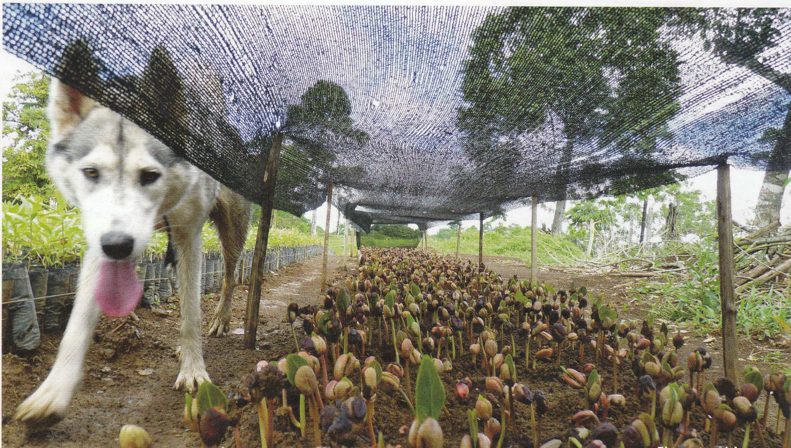
Eine gut gesicherte Anlage: Baumschule auf der Finca La Virgen.