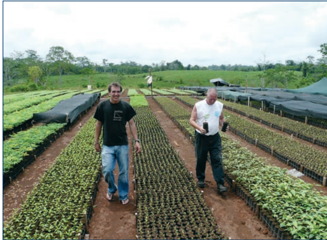
Die Baumschule auf der Finca San Rafael, Costa Rica

punkt sollen laut Planung 225 Teakbäumen pro Hektar schlagreif sein. Bei durchschnittlichem Wachstum erreiche Teak nach 20 Jahren eine Holzmenge von 0,9 m 3 pro Baum, heißt es. Daraus errechne sich die prognostizierte Erntemenge (225x0,9=202,5).