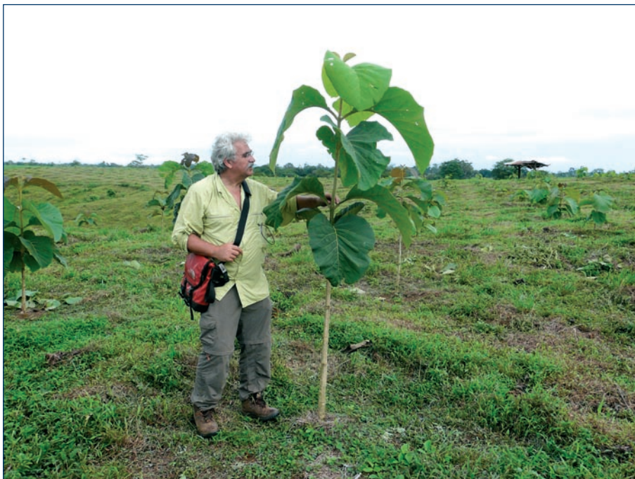
Ein Jahr altes Teak-Bäumchen

Die ökologische Wirkung von Aufforstungen ist eindeutig positiv. Der Wald speichert CO 2 und verbessert das lokale Klima. Teil der Planung sind zudem Flächen, auf denen kein Plantagenbau betrieben wird. Sie dienen als Schutzzone für seltene Tier- und Pflanzenarten.